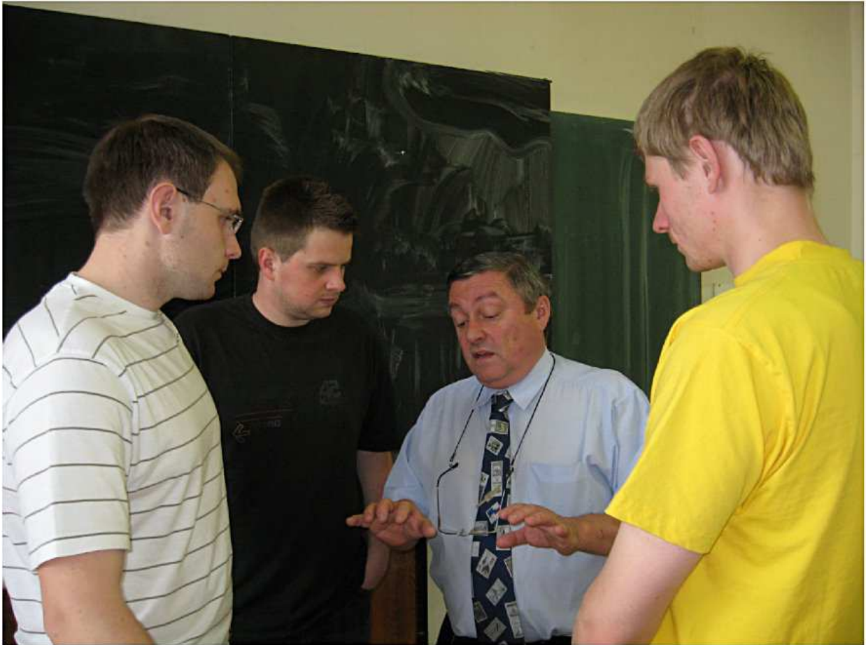
Celostátní kolo FO 2010