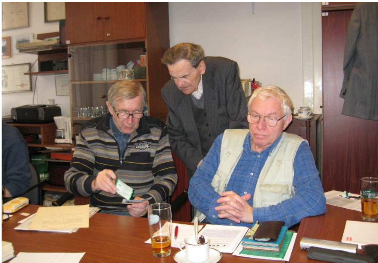
Oblastní kolo FO 2011