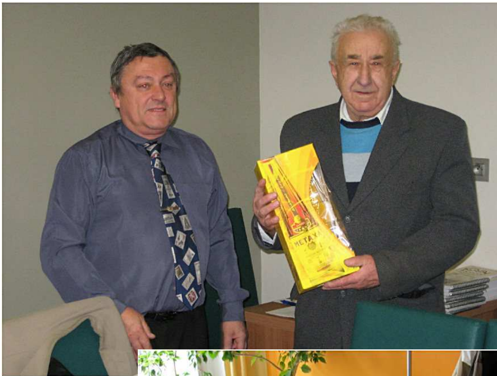
Oblastní kolo FO 2009