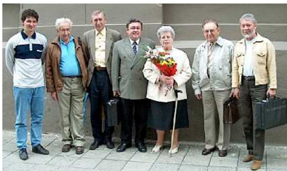
Společné foto 2006