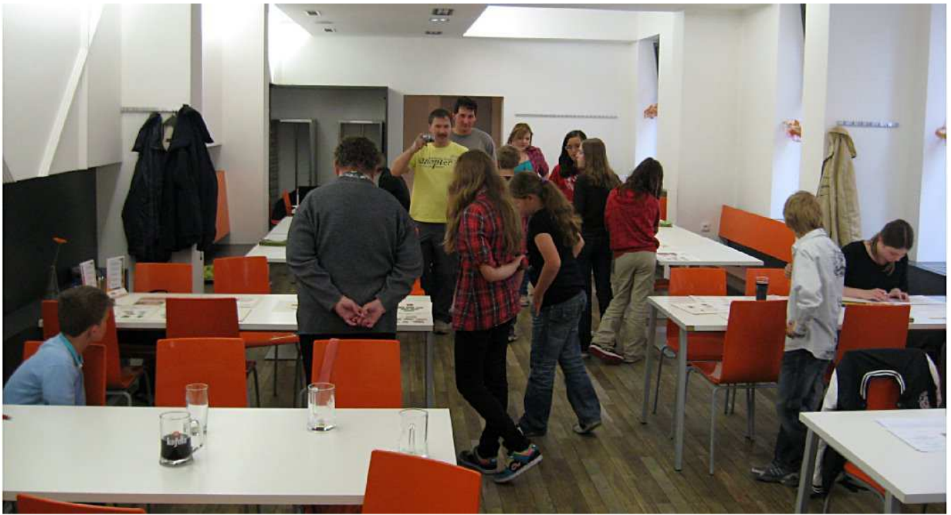
Celostátní kolo FO 2013