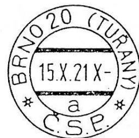
Dvě z řady tuřanských razítek.