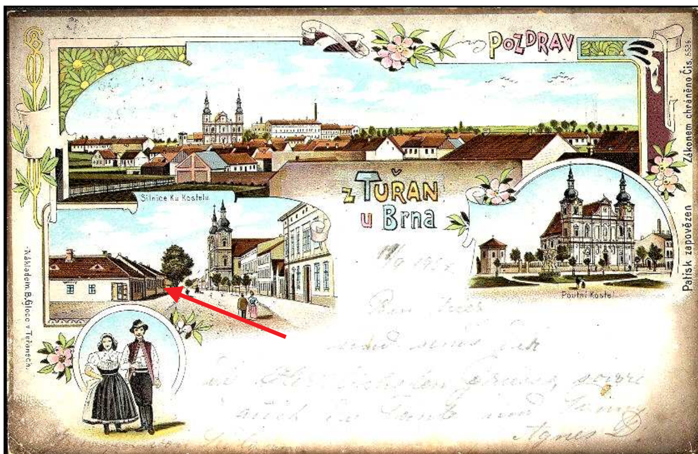
Šipkou je na dobové pohlednici vyznačen objekt první tuřanské pošty (Punč.)